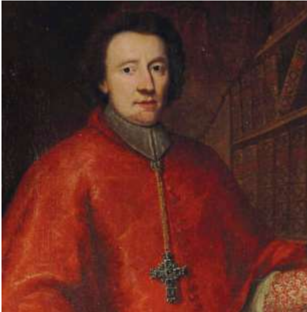
Thomas Philippus D'Alace